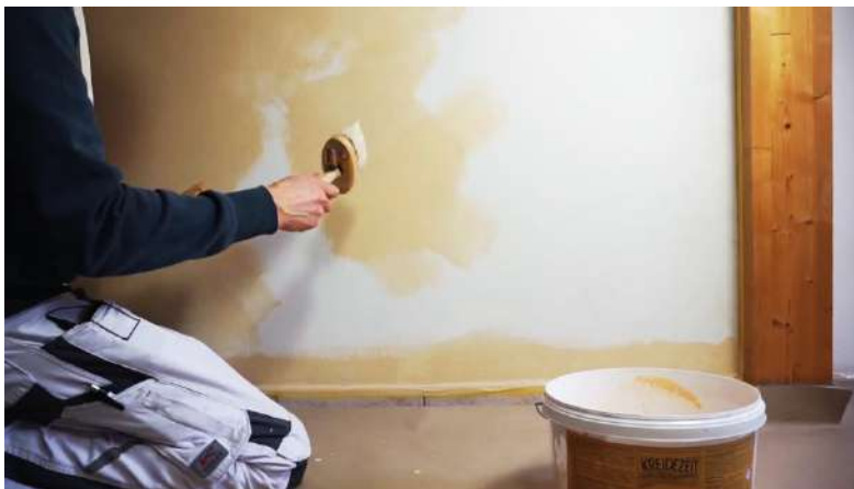
Exemple de l'application de la peinture en masses nuageuses, irrégulières et de grandeurs variables, et en diagonales.