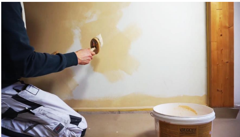
Exemple de l'application de la peinture en masses nuageuses, irrégulières et de grandeurs variables, et en diagonales.